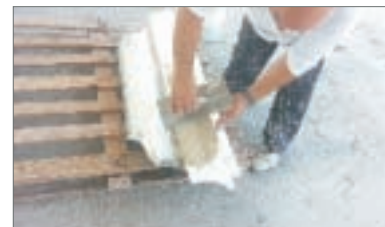
6 - Stendere la colla con spatola dentata