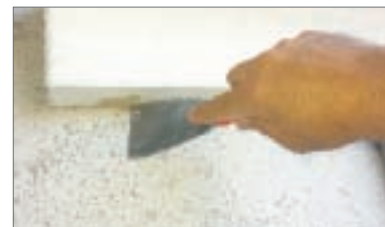
12 - Eliminare la colla in eccesso