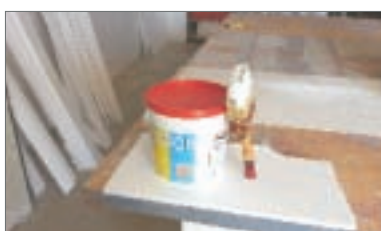
16 - Verniciare con pittura elastomerica