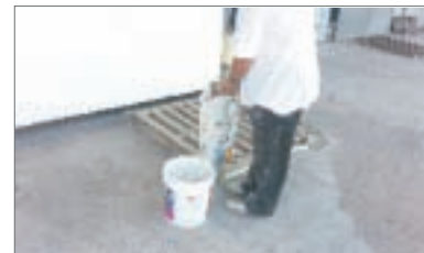
3 - Diluire con 30% di acqua e mescolare