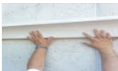
8 - Farla aderire con una leggera pressione