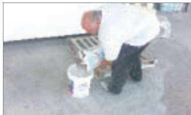
2 - Svuotarlo in un secchio vuoto