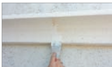
14 - Utilizzare una spatolina