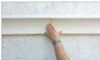
11 - Lasciare tra le cornici circa 2mm della colla MS180