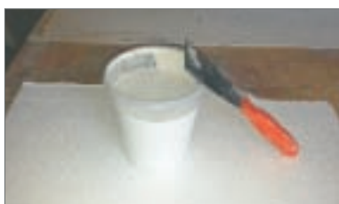
13 - Stuccare con la graniglia bianca