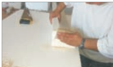
5 - Carteggiare la parte tagliata per renderla liscia e pulita