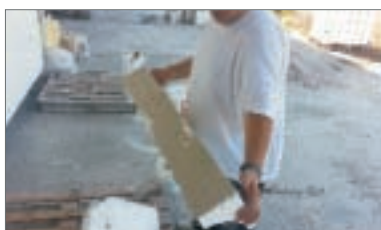
7 - Avvicinare la cornice alla parete da rivestire