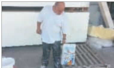
1 - Prendere il collante Bonding