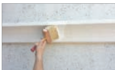
17 - Eseguendo due mani di pittura