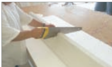
4 - Tagliare la cornice nella giusta misura