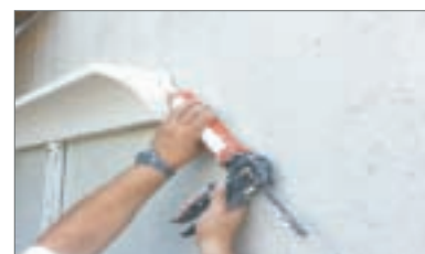
9 - Applicare la colla MS180 sui giunti