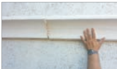
10 - Con la successiva cornice aderire al giunto