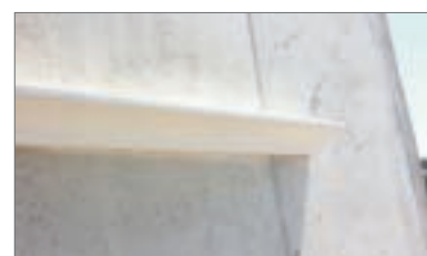
18 - Lasciare asciugare 24 ore

Gli accessori per la posa delle cornici vanno appositamente richiesti al momento dell'ordine