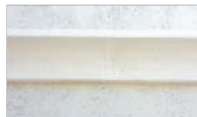
15 - Eseguire la stuccatura di tutti i giunti