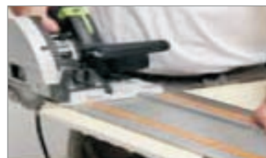
6 - Oppure con troncatrice elettrica