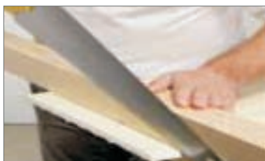
5 - Tagliare poi alla misura occorrente con sega a mano