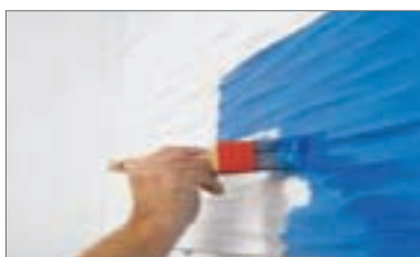
8 - Tinteggiare con idropitture lavabili

Importante: essendo un rivestimento a pannelli, si possono creare nelle giunture delle piccole imperfezioni dovute alle pareti. Tenere presente che dopo la posa il giunto rimarrà lievemente visibile come propria caratteristica e quindi non come difetto.