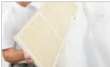
2 - Dopo aver segnato una linea a livella posizionare i pannelli alla parete