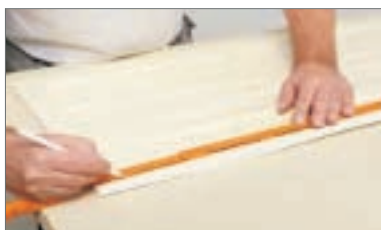
4 - Segnare la misura da tagliare