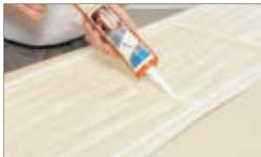
1 - Applicare la colla MS180 a strisce sul retro del pannello