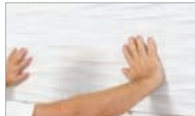
3 - Fare una leggera pressione per far aderire meglio il pannello alla parete