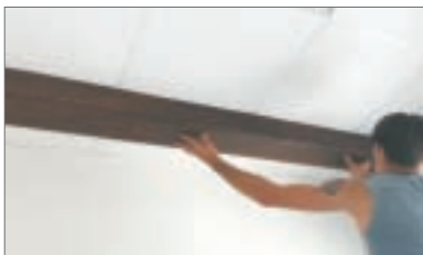
4 - Posizionare la trave tra le guide