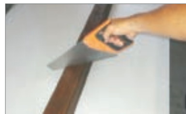
3 - Tagliare la trave nella giusta misura