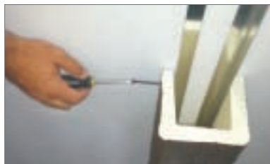
5 - Fissare la trave alle guide con viti autofilettanti