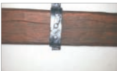
7 - Incollare la staffa con colla MS180