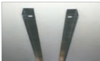
2 - Distanziarle in base alla misura interna delle travi da posare