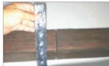
6 - Coprire le giunzioni con apposita staffa decorativa effetto ferro battuto