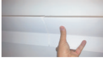
5- Avvicinare le cornici fino ad unirle ed eliminare il collante in eccesso