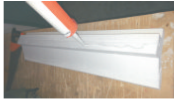
2- Stendere la Colla Ms180 sul dorso