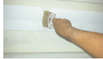
8- Tinteggiare con pitture lavabili