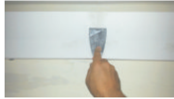
6- Stuccare il giunto