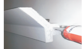
4- Applicare la Colla Ms180 sui giunti