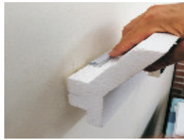
9- Inserire il Profilo Dissipatore per alloggiare la striscia Led