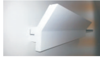
3- Posare la cornice alla parete