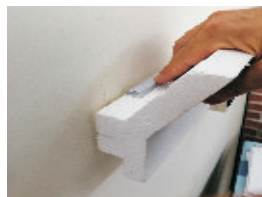
11- Inserire il Profilo Dissipatore per alloggiare la striscia Led

N.B. Gli accessori per la posa delle cornici vanno richiesti al momento dell'ordine. La Striscia Led non viene fornita ed e' reperibile presso rivenditori di illuminotecnica.