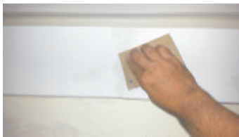
9- Carteggiare per rendere la superficie liscia e pronta da tinteggiare