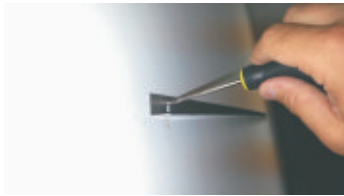
1- Fissare la Guida in alluminio sulla parete all'altezza stabilita e posta a livella.