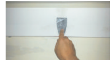
8- Stuccare il giunto