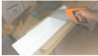
2- Tagliare la cornice