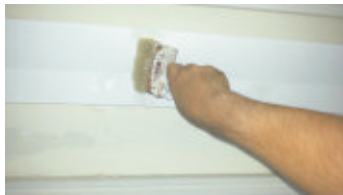
10- Tinteggiare con pitture lavabili