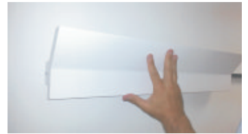
4- Inserire la cornice nella guida