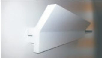
5- La cornice sara' cosi' ben allineata