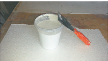
8- Utilizzare la Graniglia per eseguire le stuccature dei giunti e dei finali laterali