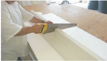
3- Tagliare l'elemento alla misura occorrente