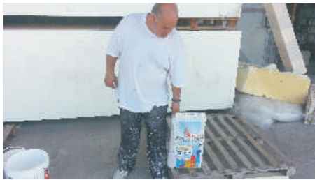
1- Prendere il Collante Bonding e svuotarlo in un secchio da Kg.25