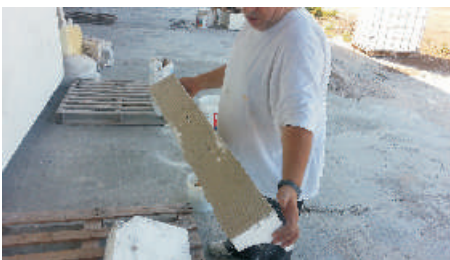
6- Posizionare sulla parte da rivestire facendo pressione fino alla completa adesione