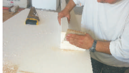
4- Carteggiare la parte tagliata per renderla liscia e pulita