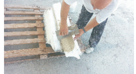
5- Stendere la colla con spatola dentata nella parte da incollare