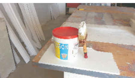
9- Dopo 24 ore verniciare con Pittura Elastomerica per esterni in 2 mani.