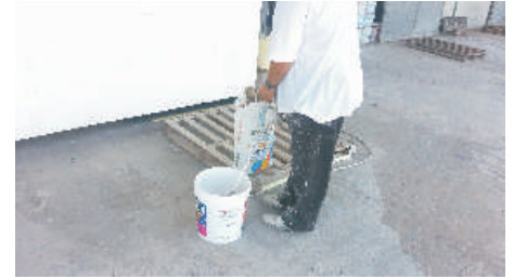
2- Diluire con 30% di acqua e mescolare