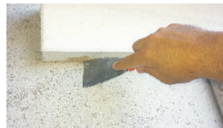
7- Eliminare la colla in eccesso